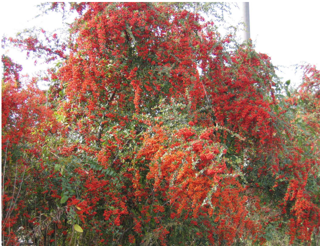
皿井洋蘭園の防風用の生垣

比較的温暖な地、ここ知多半島でも11月下旬 霜が降り始めました。以前に比べると1ヶ月ほど遅い初霜です。この時期になると農園の周りに植えた ピラカンサ の実が 真っ赤な生垣を作ります。実が熟し始めると鳥たちが大挙して押し寄せますが、食べつくす事ができません。私ができる唯一の自然への恩返しかもしれません