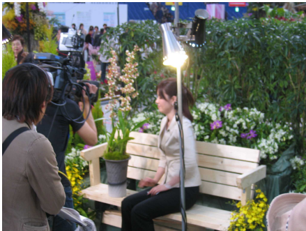
当園の展示でTVの撮影風景。