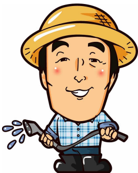
先日、わたしの似顔絵書いてもらいました。似てる？

当園のオリジナル洋蘭 ハッピーポンポコの不思議な香を感じて頂くため、家族に温室を任せ、3/14~3/19まで名古屋ドームのイベント フラワードームに出展してきました。