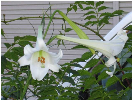
お盆前になるとササユリの花が咲き始める。 年々増え、近所の土手はこのユリで埋まっていく。