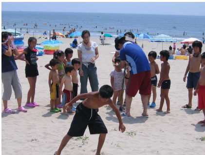
先日、小六の末娘と子ども会の海水浴に参加、 これで子ども会の行事参加も終了です。