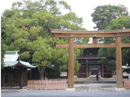
先日東京出張の折、明治神宮へ、かすかな東京の音と共に荘厳な雰囲気でした